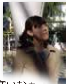
寒いなあ... 後輩君、まだかな...