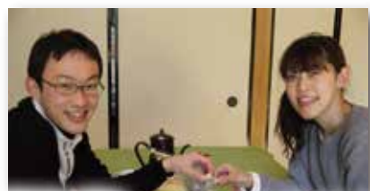
せっかくだから一緒に 食べましょう、先輩!!