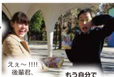
ええ~!!!! 後輩君、 マイチョコ!?