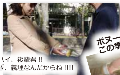
ハイ、後輩君!! ぎ、義理なんだからね!!!!