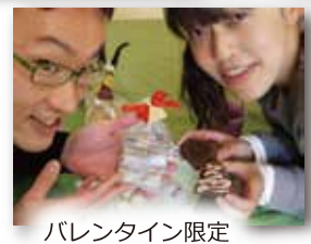
バレンタイン限定 チョコレートクラシックもあるよ!