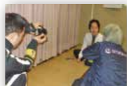
インタビューの様子を職員が背後からさらにカシャリ