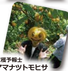
収穫予報士 アマナツモヒサ

あまなつフェアは、6月7日、8日に開催します。皆様、ぜひ行ってみたいかがでしょうか!それでは、情報番組『得ダヨネ?』今日はこの辺で。よい一日を!