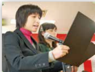
司会者インタビュー

—司会は緊張しましたか？ 緊張は少ししたけど、本番は大丈夫だった。 (直前の)練習は全部合格でした。 —新しく仲間が増えた感想は？ 仲良くなって、友達が増えて嬉しいです。 —上手に司会ができるコツはありますか？ 前を見て、あまり下を向かないようにして、 文字(台本)を見るようにしました。楽しかったです。