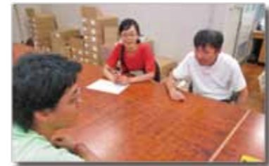
▲編集会議の風景「なにやろうか?」