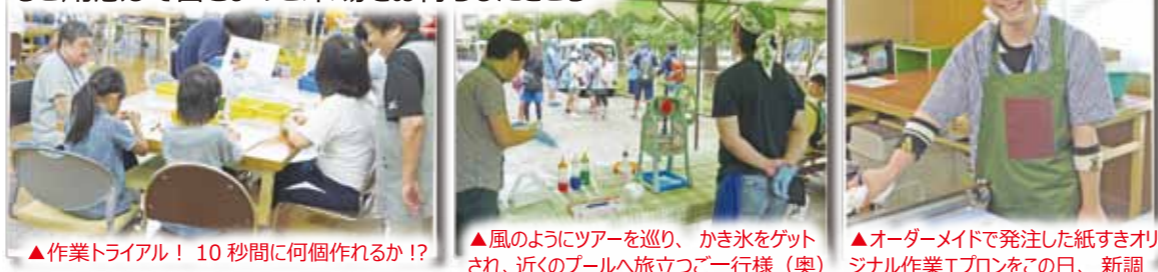
▲作業トライアル！10秒間に何個作れるか！?